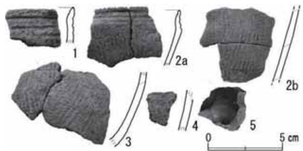
図3 Ts4出土遺物(1～4:縄文土器, 5:石器)

引用文献 平川一臣 2013「日本海東縁の津波堆積物古津波履歴」国交省 2013.2. 13 資料—3