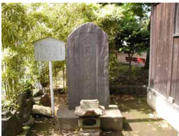
図5 大鳥公園横の慰霊碑(2009年5月)。右横は大鷲神社のお社。

平塚第一小学校の旧校地を図2に示す。現在の市民センター前、公民館の横にあたり、樟樹(くすのき)の古木と、これも平塚観光協会による「平塚小学