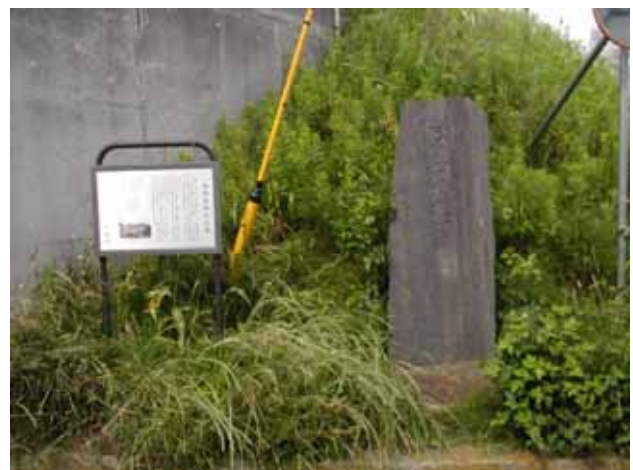
図6 馬入橋西詰にある陸軍架橋祈念碑(2009年5月)。 Fig.6 The monument for the reconstruction of Banyu bridge.

記念碑の脇には平塚市による説明板がある。その内容と今泉(2000)をあわせて状況を説明すると、震災復旧には交通網再建整備が急務であり、先ず馬入橋の復旧に着手した。最初は、馬入の消防組員と在郷軍人が応急措置として仮橋を二つ造ったが、9月16日の豪雨で流失した。図1の震災地応急測図原図をみると、調査工程の9月6日から15日のいつかの時点での馬入橋の状況について「全壊シ河中ニ落下シ未ダ復旧工事ニ着手セズ 両河岸間ノ連絡は渡船ヲ以テス」とある。渡船時間は午前5時から午後6時であり、「但シ公務員ハ除外」と付け加えられてい