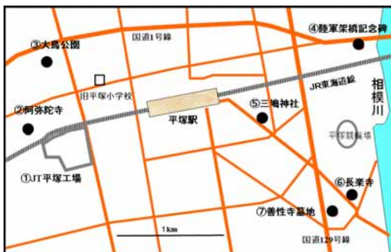
図2 平塚市内の関東大震災関連の慰霊碑や記念物の所在。 Fig.2 Map of memorial towers and monuments in Hiratsuka City