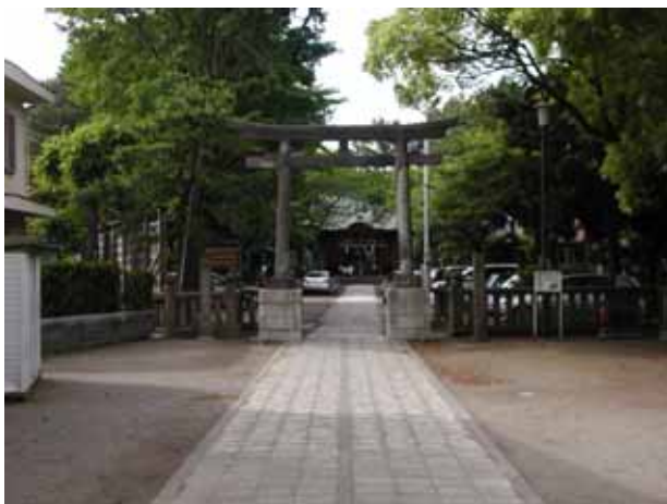
図7 三嶋神社の境内(2009年5月)。正面奥が本殿、手前が二の鳥居。

三嶋神社には他の場所と異なり特別の慰霊碑が在るわけではないが、「復興寄付 金壱千圓也 昭和二年一月須賀漁業組合」と書かれた石塔や二の鳥居の社殿側から見て向かって右側の柱に「大正十五丙寅歳八月再建」、左側には「明治十八丁酉歳五月修膳」(丙:ひのえ、丁:ひのと)とある。右側は関東大震災の被害を受けての再建の記録と考えられる。また神社の話では、関東大震災では本殿に大きな被害は無かったが、1945(昭和 20)年の平塚空襲で焼け、現在の本殿は戦後再建されたものである。写真(図7)は二の鳥居と本殿である。二の鳥居と一の鳥居との間には弁天社が今でもあるが、高瀬(1970)によれば、これを中心に三十年ほど前まで(昭和 20 年ころまでか)池が2つあったと書かれている。神社の話では、震災後池に水が流れ込みにくくなり、水質も悪くなって結局埋め立てたとのことであった。都市化など