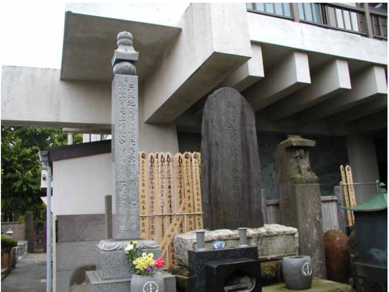
図 4 阿弥陀寺境内にある供養塔(2009 年 5 月)。

大鳥公園は、阿弥陀寺から北東に約 500m離れた所にある。その南西の隅に大鷲神社(おおとりじんじや)があり、神社の社の隣の猫の額ほどの敷地に高さ約 1.5m の慰霊碑がある(図 5)。碑文は以下の通りである。