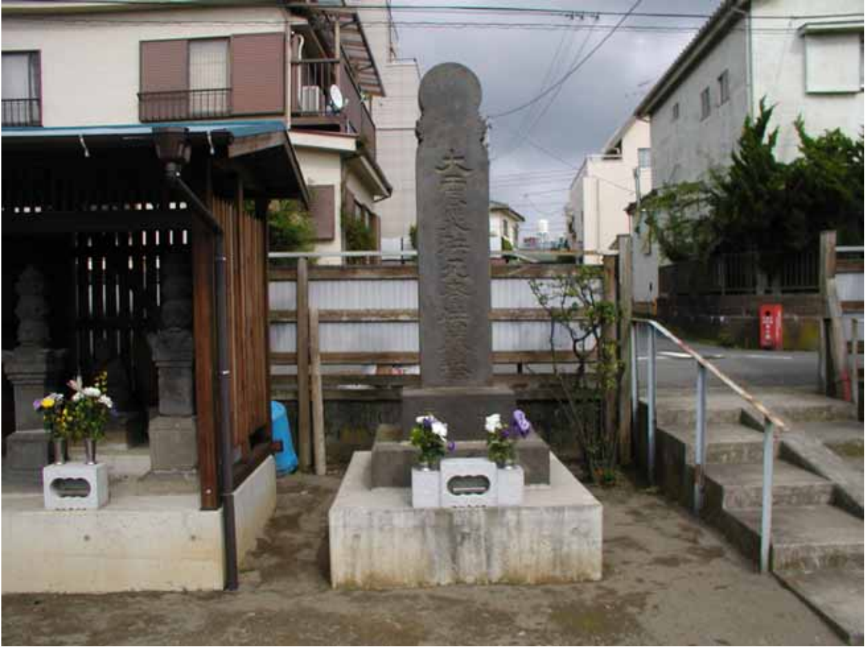
図 8 長楽寺の供養塔(2009年5月)].