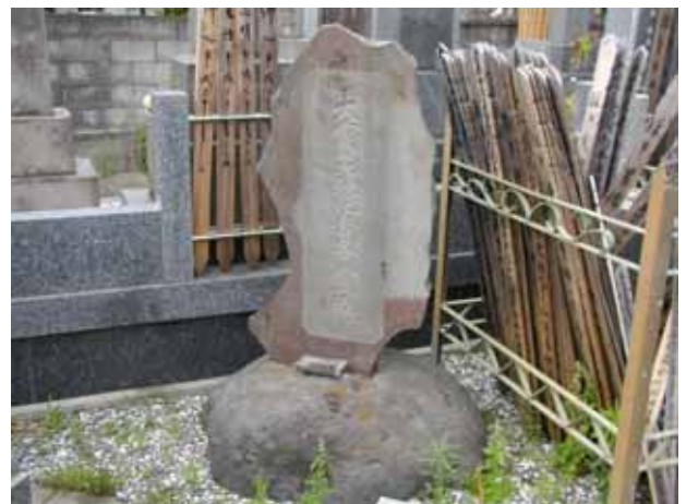
図 9 善性寺墓地内にある慰霊碑(2009 月 5 月).

長楽寺周辺は、寺町と呼ばれていたように寺院が多く存在する。慰霊碑のある善性寺墓地は海宝寺に