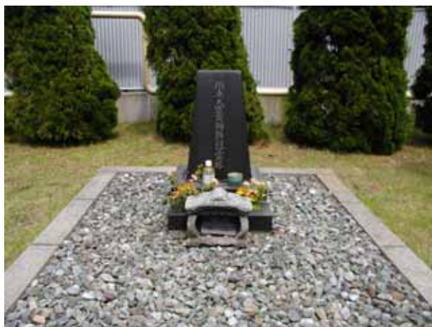
図 3 日本たばこ産業(JT)工場構内の慰霊碑(2009年 5月).

現在の工場の敷地は西坂(1926)の引用中にある相模紡績株式会社の工場に対応する。図 1 で「紡績会社, 全部倒壊」と書かれたところがそれに当たる。今泉(2002)によれば, 相模紡績は 1916(大正 5)年に設立された会社で, 震災当時従業員約 3000 人を擁していたが, 煉瓦建の工場であったため, 倉庫の一部を残して大半の建物が全壊して死者 144 名, 重傷者 25 名を出した。一般に当時の紡績工場は昼夜二交替制がとられ, 144 名のうち, 60 名は寄宿舎で睡眠中に家屋倒壊のため圧死, 他は工場より脱出中に煉瓦壁倒潰により圧死した。西坂(1926)と死者数, 負傷者数は多少異なるが総じて大きな被害を出したこと