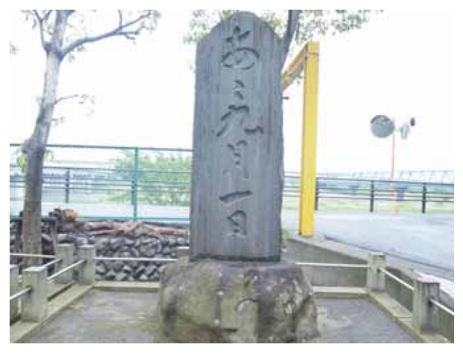
図 15 厚木大橋の際にある厚木町の慰霊碑 Fig.15 Memorial tower of Atsugi Villedge near the Atsugi bridge erected for the soul of victims .

厚木神社の隣,相模川に架かる厚木大橋の際に2つの石碑が建っている.左側は史跡として烏山藩厚木役所跡を示す石碑であり,右側に震災記念碑がある(図15).