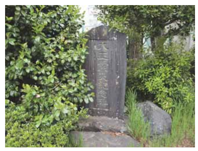
図 6 大田小学校の隣にある慰霊碑 Fig.6 Memorial tower of the park near the Ota elementary school in Isehara for the soul of victims.

碑文における"上ヤ"などは明治初期に大田村が成立する前の村名(集落名)で、現在でも地名として残っている。集落ごとに犠牲者の名前が書かれている。また、本震だけでなく、翌年1月の丹沢の余震による死者が区別され、小稲葉の2名が刻まれている。余震でも相当な被害が出たことがわかる。