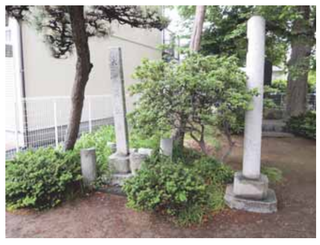
図 26 川寿稲荷神社にある震災記念碑

なお現在の鳥居は左柱裏に「昭和十四年三月建 之」, 右柱裏に「願主 平井 蔳」と書かれている.