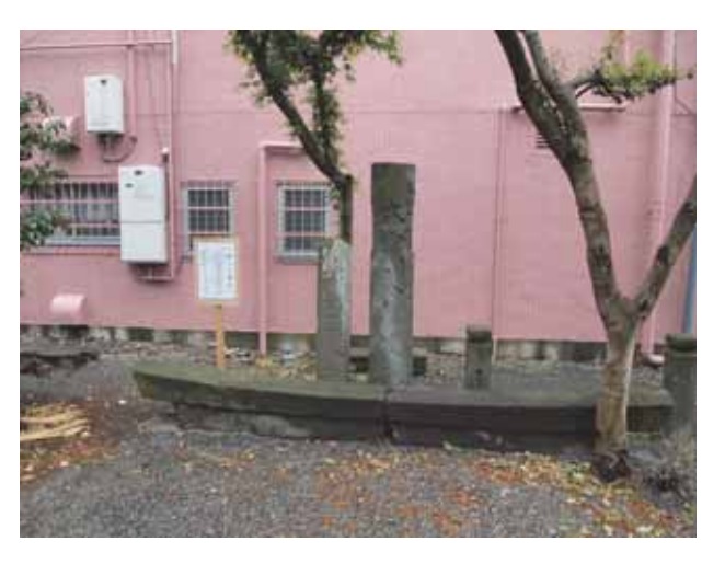
図 14 厚木神社にある震災により壊れた鳥居の残骸で作られたモニュメント

この鳥居は 1828(文政十一)年に建立されたもので関東大震災によって倒壊して無残な姿になったものと思われる. 横には「郷社厚木神社」と書かれた古い社標の残骸も建っている. 現在の鳥居には建立年の記載はないが, 現在の社標の裏には昭和2年7月と建立年が書かれており, 震災で被害を受けた鳥居と社標を同じ時期に建て替えたものと思われる.