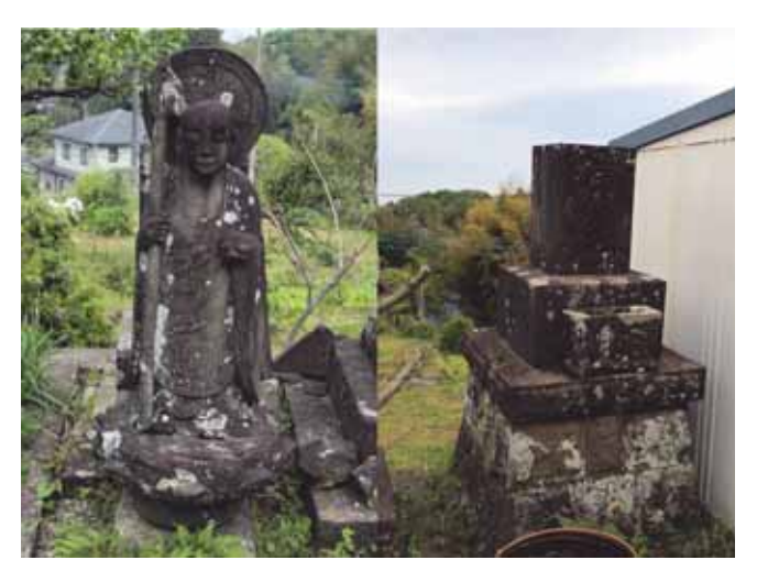
図 18 宝増寺の供養塔(地蔵とその台座)

故郷を遠く離れた地で非業の死を遂げた女性を通して震災の痛ましさを今に伝える供養塔である.