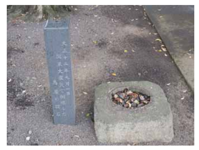
図 24 諏訪神社にある旧鳥居の基礎と説明の石碑 Fig.24 The basement of the old torii at Suwa Shrine destroyed by the Great Kanto earthquake.