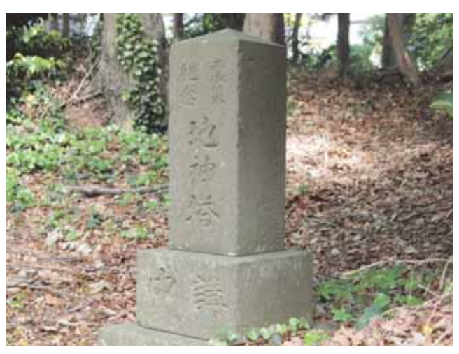
図 28 深谷神社にある震災記念の地神塔 Fig.28 Jishin-to erected for the memory of earthquake at Fukaya Shrine in Ayase.

ここで社日とは地神講が開かれる日で、年に2回春秋の彼岸に最も近い戊(つちのえ)の日のことをいう.