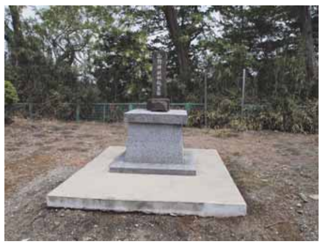
図 21 山際神社の社殿旧趾碑