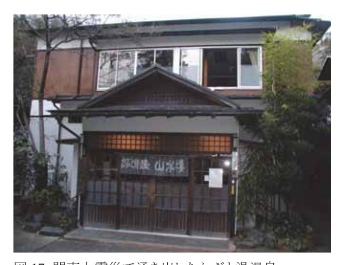
図 17 関東大震災で湧き出したかぶと湯温泉 Fig.17 Kabuto-yu hot spring beginning to gush up out by the Great Kanto Earthquake.

山水楼のホームページによれば、関東大震災のときに、かぶとの形をした岩のふもとから温泉が湧き出したと言われている。その岩は田の中の畳二畳敷き位の大きさの岩で、この一帯の田んぼを村人達は「かぶと岩の田んぼ」と呼んでいた。それがかぶと湯温泉の名前の由来だという。温度は 25 度以下であるがメタケイ酸とメタホウ酸の含有量が規定値以上で温泉法の温泉に当たる。関東大震災で湧き出して以来、現在もそのまま自然湧出したお湯を使っているという。