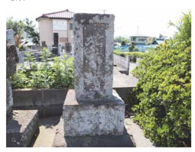
図 27 深谷上六丁目墓地にある震災記念の地神塔 Fig.27 Jishin-to erected for the memory of earthquake at grave yard of Fukaya-kami in Ayase.

に架かる観音橋を渡ると右手に長竜寺があり、その前の県道 45 号線から左に入る小道を 200m ほど行くと左側に墓地が見え、その路傍に地神塔がある(図27).