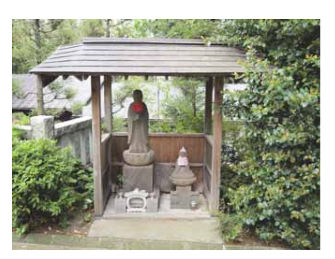
図 5 泉龍寺の震災死者追善地蔵尊(左) Fig.5 Jizo statue in Senryu-ji Temple in Isehara erected for the souls of victims.

沼目2丁目(西沼目バス停前)にあった岡田医院 は現在は閉院しているが、先代の遺徳が受け継がれ ていることが分かる.