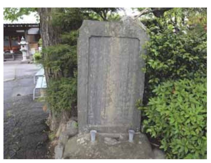
図 22 増全寺の慰霊塔

震災で亡くなった28人の檀信徒の名が刻まれている. 当時の住職が建てたものと思われる. 門柱には左柱裏に「三十四世玉城荘全七十七才」とあり, 右柱裏に「大正丁巳季喜寿建設」とある. 丁巳は1917(大