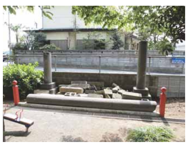
図 12 岡田三嶋神社にある壊れた鳥居の残骸で作られたモニュメント