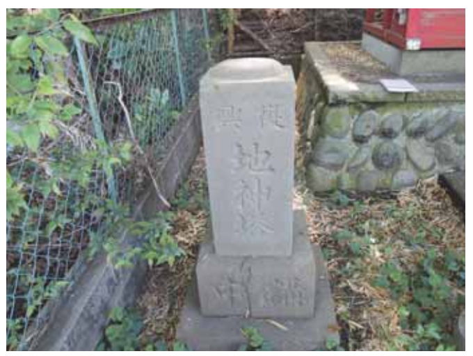
図 29 深谷中7丁目稲荷神社の震災記念の地神塔 Fig.29 Jishin-to erected for the memory of earthquake at Inari Shrine of Fukaya-naka in Ayase.

この碑には被害状況も書かれており、講中 14 戸の うち 6 割近い 8 棟の住家が全潰し、その他の建物も 12 棟が半潰ということで、かなり大きな被害が出たこと が分かる.