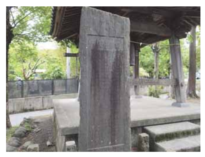
図 19 上荻野浅間神社の鐘楼再建碑 Fig.19 Memorial tower of the recovery of the bell tower belfry in Sengen Shrine at Kamiogino in Aatsugi.