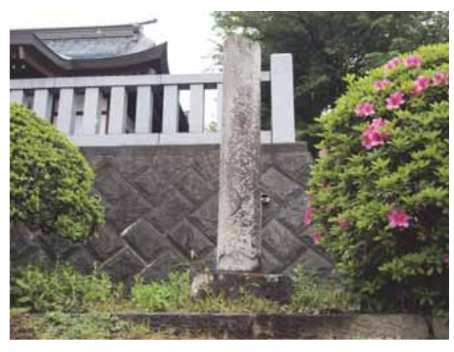
図 16 恩名三嶋神社にある震災により壊れた鳥居の残骸で作られた震災記念碑

(左面)維時天保十二年立 初夏摩訶日 再建焉 (右面)大正十二年九月一日 當村 下煤ケ谷住 石工