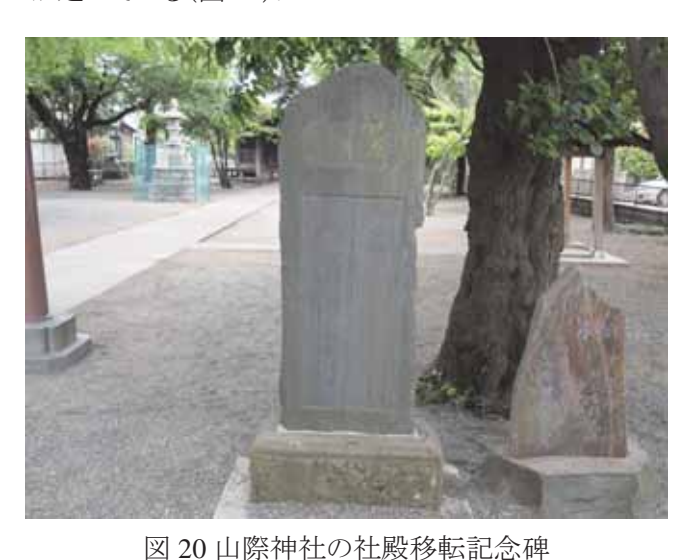
Fig.20 Memorial tower of the movement of the main hall of Yamagiwa Shrine in Atsugi.