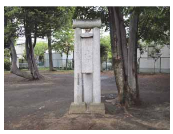
図 25 大島記念公園にある震災記念碑