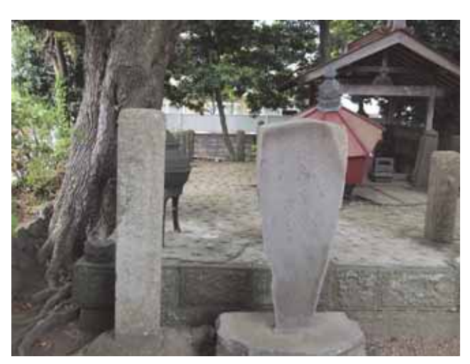
図 4 太田道灌の墓所復旧碑(左). 右は歌碑 Fig.4 Memorial tower of the recovery for the grave yard of Ota Dokan (left side) in Isehara.

この地にあった上杉館で殺された. 洞昌院は道灌によって建てられた寺である. 碑文によれば, 道灌の墓所が本震と翌年の丹沢の余震によって大きな被害を受け, 村内(当時は上粕屋村を含め高部屋村)の人々の協力で復興したことを伝える記念碑である.