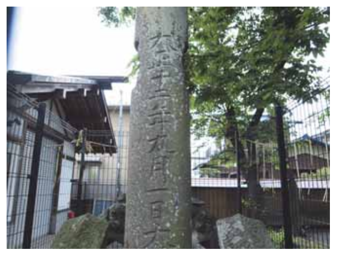
図 23 諏訪神社にある震災により壊れた鳥居の残骸で作られた震災記念碑

増全寺から東へすぐの所に諏訪神社がある. 小田 急線厚木駅南東約 500m の場所である. 社殿の正面 に向かって左側に大震災記念碑がある(図 23). 危 険防止の為にフェンスで囲まれている.