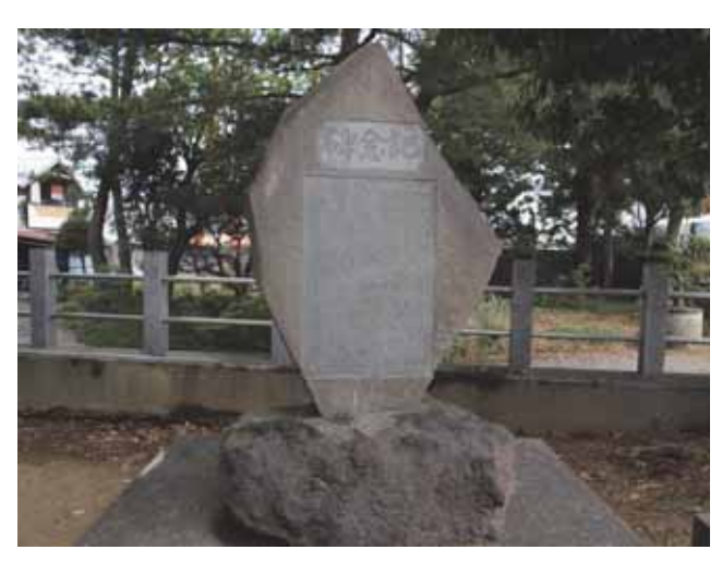
図 10 上戸田子易神社の記念碑 Fig.10 Memorial tower of Shieki Shrine of Kamitoda in Atsugi erected for the soul of victims .

相川村のうち、上戸田地域の十三回忌の慰霊碑である. 内容は八幡神社のものと大変よく似ている.