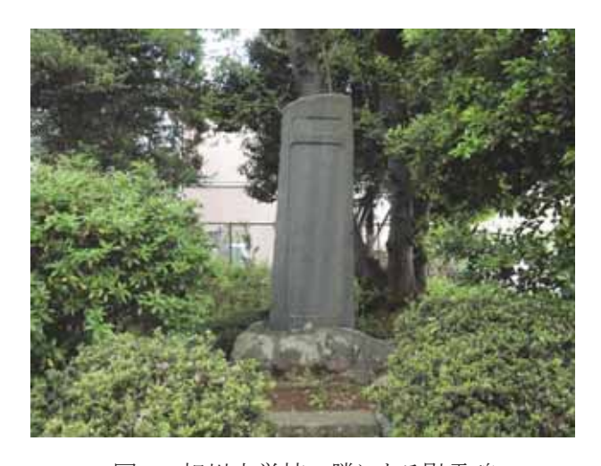
図 11 相川中学校の隣にある慰霊碑 Fig.11 Memorial tower of Aikawa Village in Atsugi erected for the soul of victims .